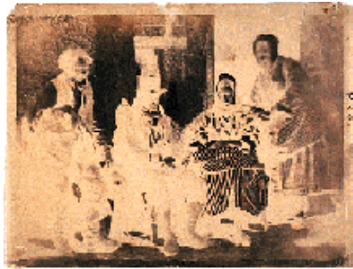
Négatif du calotype

positif, que nous connaissons aujourd'hui dans le matériel photo classique et qui rendit possible le tirage d'un grand nombre de reproductions à partir d'une photo prise une fois.