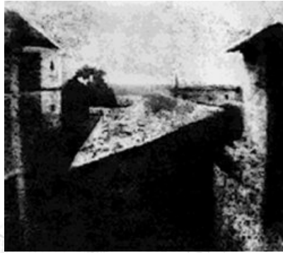
En 1827, Nicéphore Niépce photographia le paysage à partir de sa fenêtre . à Saint-Loup-de-Varennes (1826)

Images positives de NIEPCE à l'aide du bitume de Judée étendu sur une plaque de verre ( bitume soluble dans l'essence de lavande et le pétrole,et insoluble là où il a été impressionné par la lumière )."Vue d'une Fenêtre",la "Table Servie". NIEPCE invente également la Photogravure ("Le Cardinal d' Amboise", "La Sainte Famille").