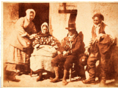
Positif du calotype